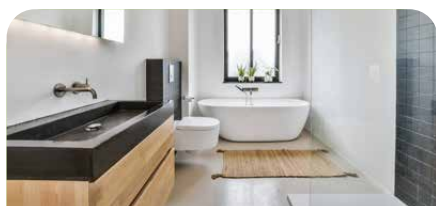
Komfort. Zum Wohlfühlen