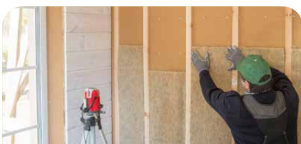
Nachhaltig. Bauen & Sanieren