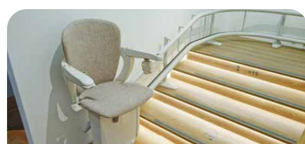
Lebensraum. Für Alle