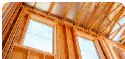
Holz. Bauen & Leben