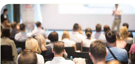
Wissen. Aus erster Hand