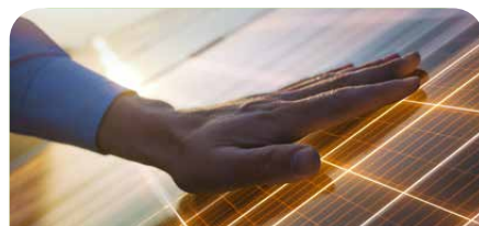
Zukunft. Erneuerbare Energie