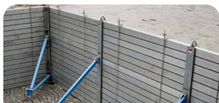
Sicherheit. Für Extremfälle