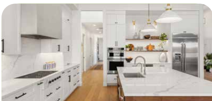
Erlebnis. Küche & Kochen