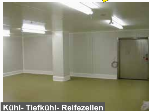
Kühl- Tiefkühl- Reifezellen

fachgerechte Montagen durch hauseigene Monteure