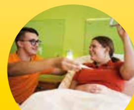
Bezahlte Anzeige im Auftrag des Landes Niederösterreich