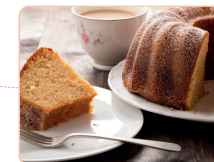
URKAFFEE (Mehlspeisen & Kffee)