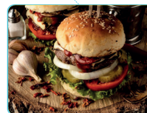
FOODTRUCK HANSELMANNSBURGER (Burger)