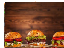
JESSNITZHOF FAM. FENZL (Spezialitäten vom Hochlandrind)